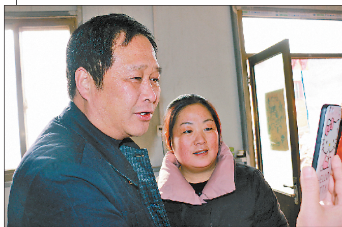
◇慰问小组领导通过手机视频鼓励某部战士安心服役、献身国防。