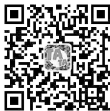
更多快乐，请扫描二维码 关注“迷彩TATA”(ID:jfbshzk)