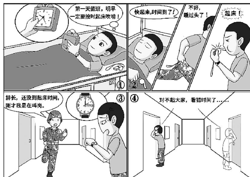
更多快乐，请扫描二维码 关注“迷彩TATA”(ID:jfbshzk)