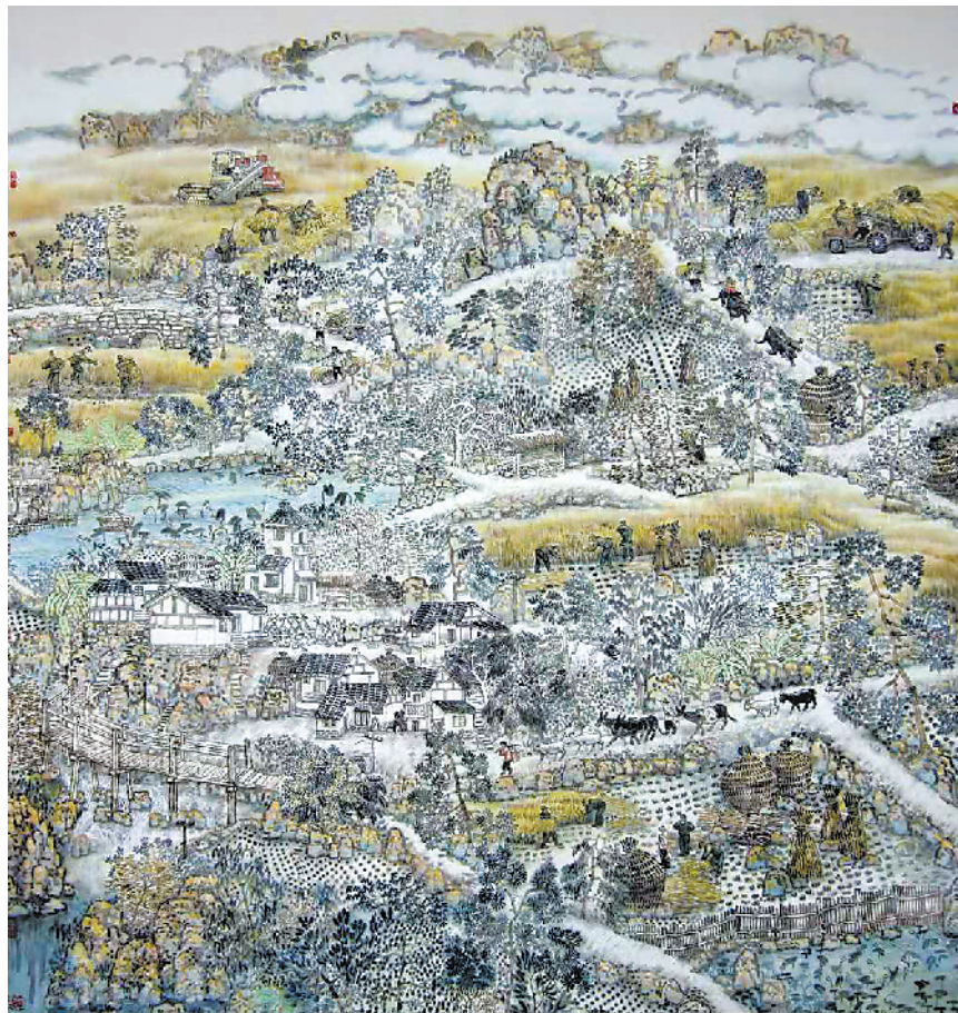
大地又逢艳阳时(中国画)